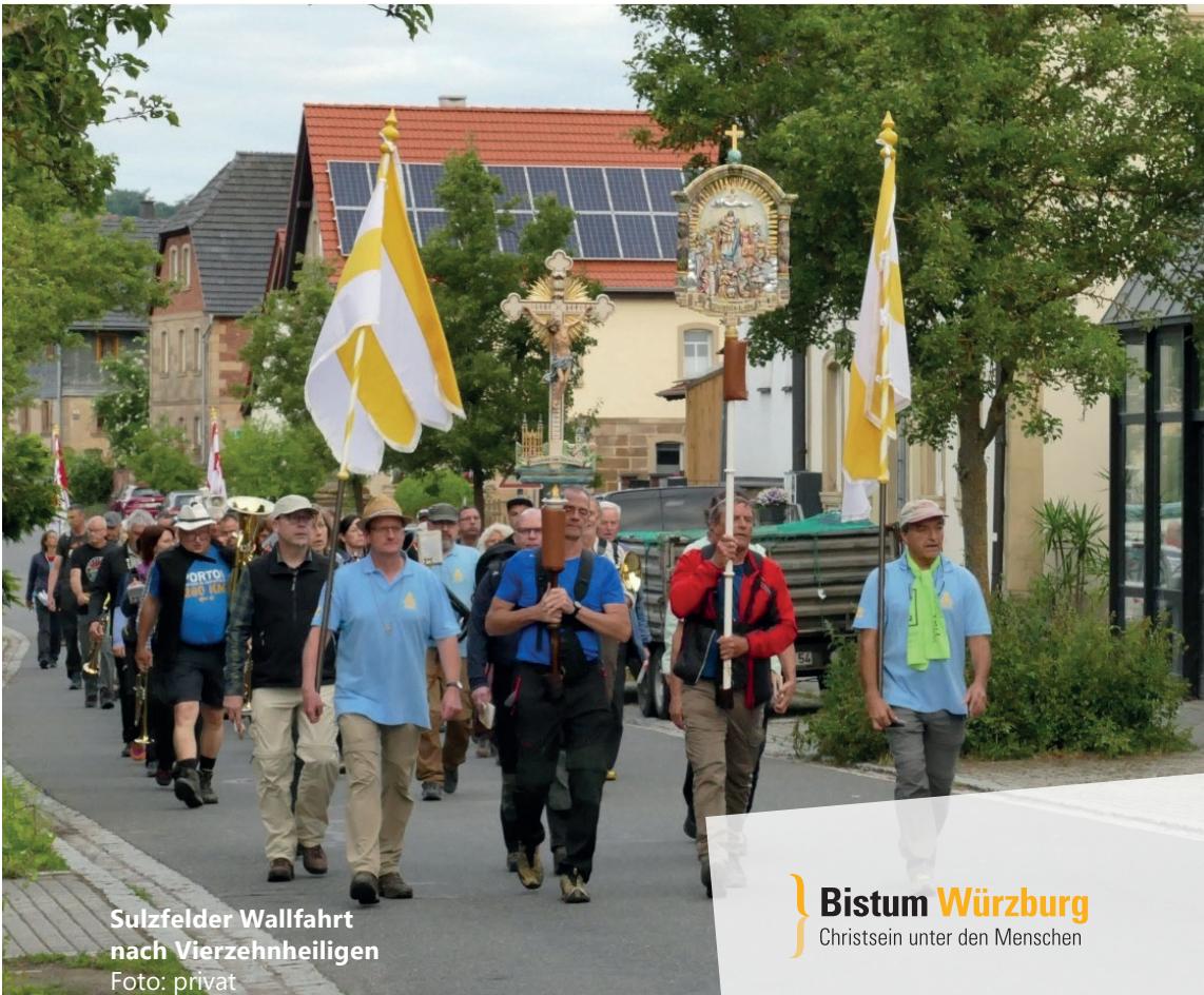
Sulzfelder Wallfahrt nach Vierzehnheiligen

Bistum Würzburg Christsein unter den Menschen