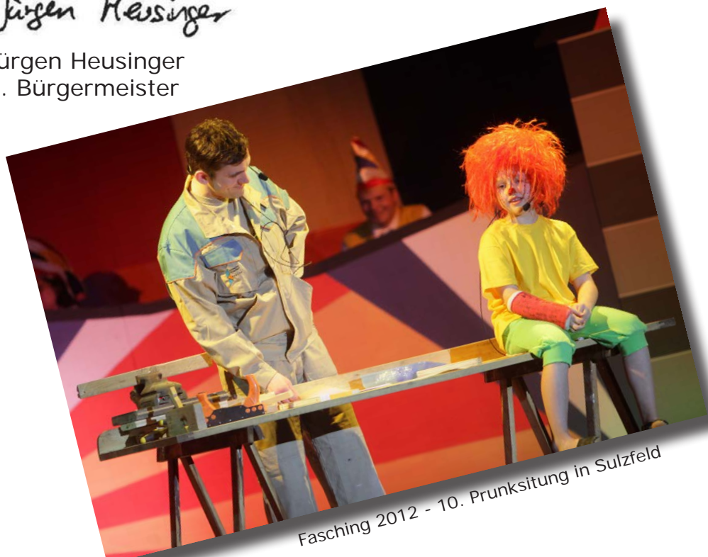
Fasching 2012 - 10. Prunksitzung in Sulzfeld